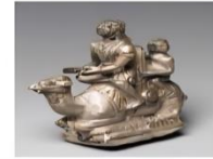
التجارة في الانباط