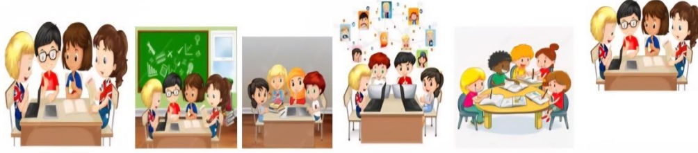
ورد الجوري ورد الياسمين ورد القرنفل ورد الفل ورد النرجس ورد التوليب

فتح باب النقاش أو طرح الأسئلة من قبل الزميلات أو المدرسة لتعميق الفهم وتوضيح النقاط المهمة.